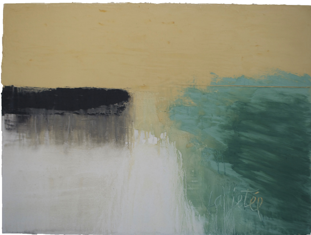
Jean Pierre Schneider. La jetée , 2018. Technique mixte. 97 x 130 cm.